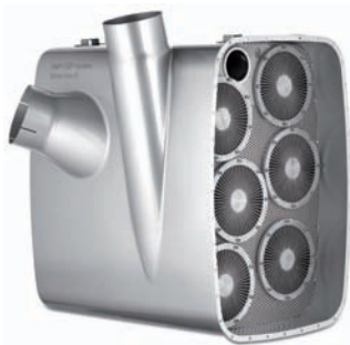
SMF®-System für Lastkraftwagen