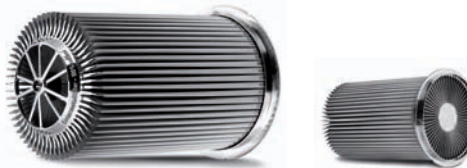
SMF® – die Kerntechnologie aller HJS-Diesel-Abgasreinigungssysteme

Die Kerntechnologie aller HJS-Abgas-Reinigungssysteme ist der Sintermetallfilter (SMF®). Der geschlossene Vollfilter für Lkw-Anwendungen mindert den Rußpartikelaußstoß samt Feinstpartikel – nahezu 100 Prozent werden gefiltert.