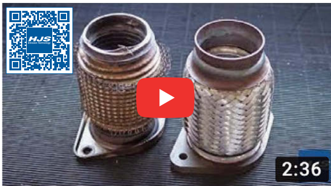
HJS Reparatur-Flexrohr mit Flansch 83 00 8311 für BMW HJS Repair flex pipe with Flange 83 00 8311 for BMW