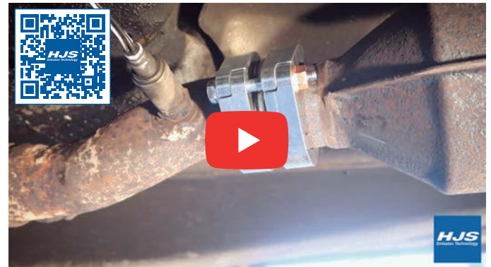
2-teiliger HJS Reparaturflansch HJS-Nr. 82 00 7055 2-piece HJS repair flange 82 00 7055